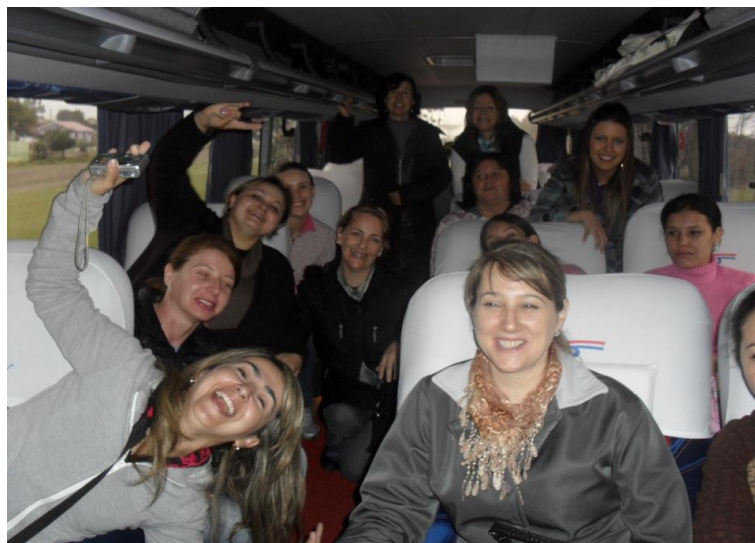
I módulo do curso Técnico em Vestuário.