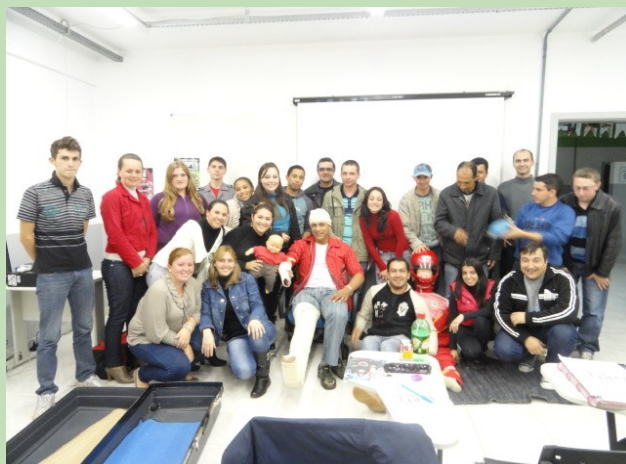
Treinamento com os Bombeiros