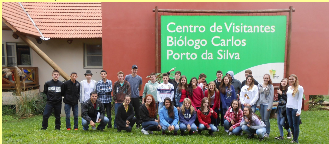
Estudantes em frente à área edificada do Parque Estadual do Turvo.

Por fim, a viagem seguiu à Tenente Portela - RS até a Agroindústria Familiar chamada “Guerra”, dedicada a produção de suco de uva e de diferentes tipos de geleias. Com uma recepção calorosa, conheceram todas as instalações e fizeram degustação.