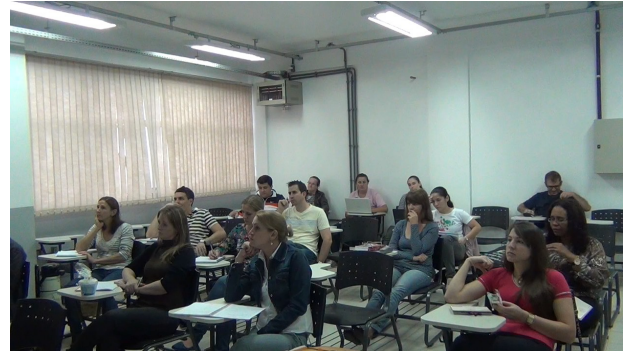
Alunos do curso de especialização em PROEJA