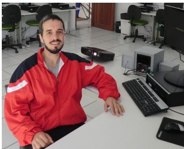
Bueno: implantação de projetos de Informática

Além de ler com muita atenção todas as informações do edital e estudar os conteúdos elencados para a prova, o servidor buscou profissionais de diversas áreas que o auxiliassem na melhor compreensão dos conhecimentos exigidos.