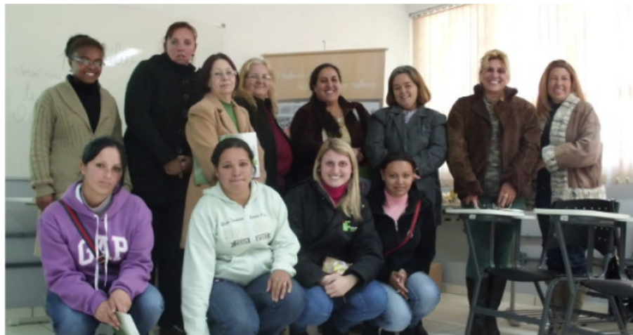
Alunas terão aulas de terça à quinta-feira até o mês de dezembro deste ano

impulsionar o desenvolvimento regional e institucional, pela melhoria do acesso de mulheres em situação de vulnerabilidade social à educação e ao mundo do trabalho.