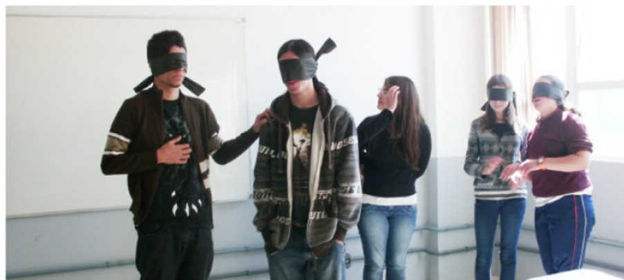
Alunos testando a percepção sem o sentido visual

Aconteceu de 19 a 22 o Trote Inclusivo com os cursos técnicos do IFSC Câmpus Lages. A atividade, organizada pelo Núcleo de Atendimento às Pessoas com Necessidades Específicas (NAPNE), teve como objetivo promover a reflexão sobre o tema inclusão no Câmpus. Foi uma oportunidade de integrar os alunos ingressantes do 2º semestre de 2013 com os alunos de 2º módulo dos cursos técnicos em Agroecologia, Biotecnologia e Informática.