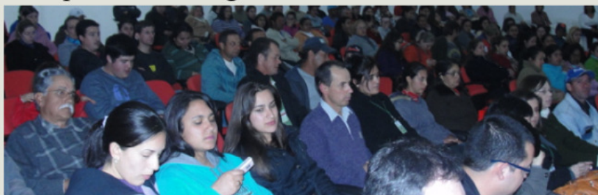
Público presente no lançamento do Pronatec em Campo Belo do Sul

O Instituto Federal de Santa Catarina (IFSC), por meio do Programa Nacional de Acesso ao Ensino Técnico e Emprego (Pronatec), deverá ofertar cerca de 700 vagas em cursos gratuitos de qualificação profissional na região da Serra Catarinense. Entre os municípios beneficiados estão Lages, Campo Belo do Sul, Otacílio Costa, Cerro Negro, Palmeira, Curitibaanos e São Joaquim. Os cursos na região são oferecidos pelo Câmpus Lages.