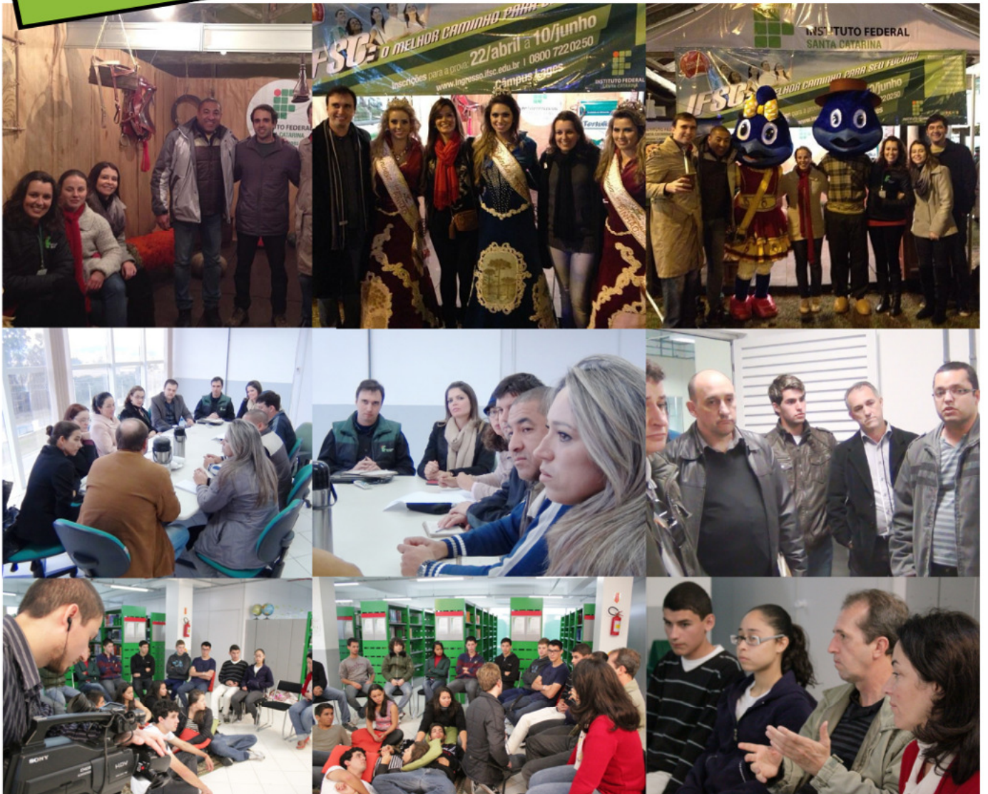
Álbuns completos no site www.lages.ifsc.edu.br / Álbuns completos no site www.lages.ifsc.edu.br / Álbuns completos no site www.lages.ifsc.edu.br / Álbuns completos no site www.lages.ifsc.edu.br

Mande suas fotos para: noticias.lages@ifsc.edu.br