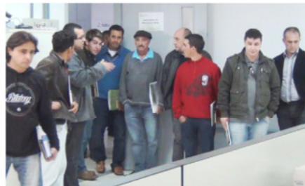
Visitando os laboratórios do câmpus

também desenvolve projetos de Pesquisa e Extensão. “É nestas atividades que estão as grandes possibilidades de levarmos o IFSC até os municípios. Desta forma podemos desenvolver trabalhos e realizar estudos dentro das necessidades específicas de cada um”, completou.