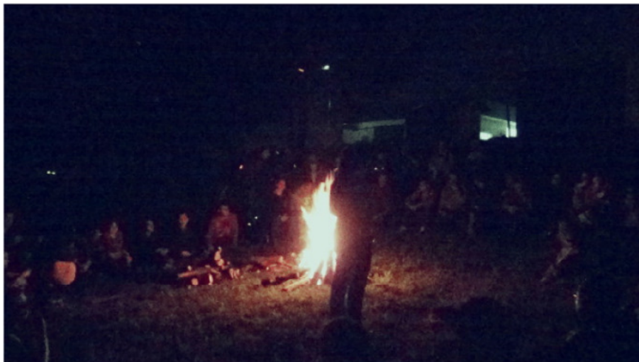
Atividades aconteceram ao redor de uma fogueira

A noite de quarta-feira (23) foi iluminada por tochas e por uma grande fogueira central que aqueceu os participantes do primeiro Luau Literário do Instituto Federal de Santa